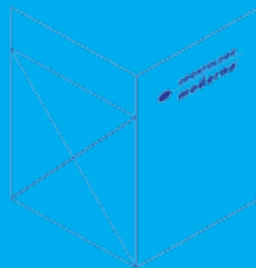
Cuarta de forros