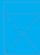
Anuncio tamaño carta